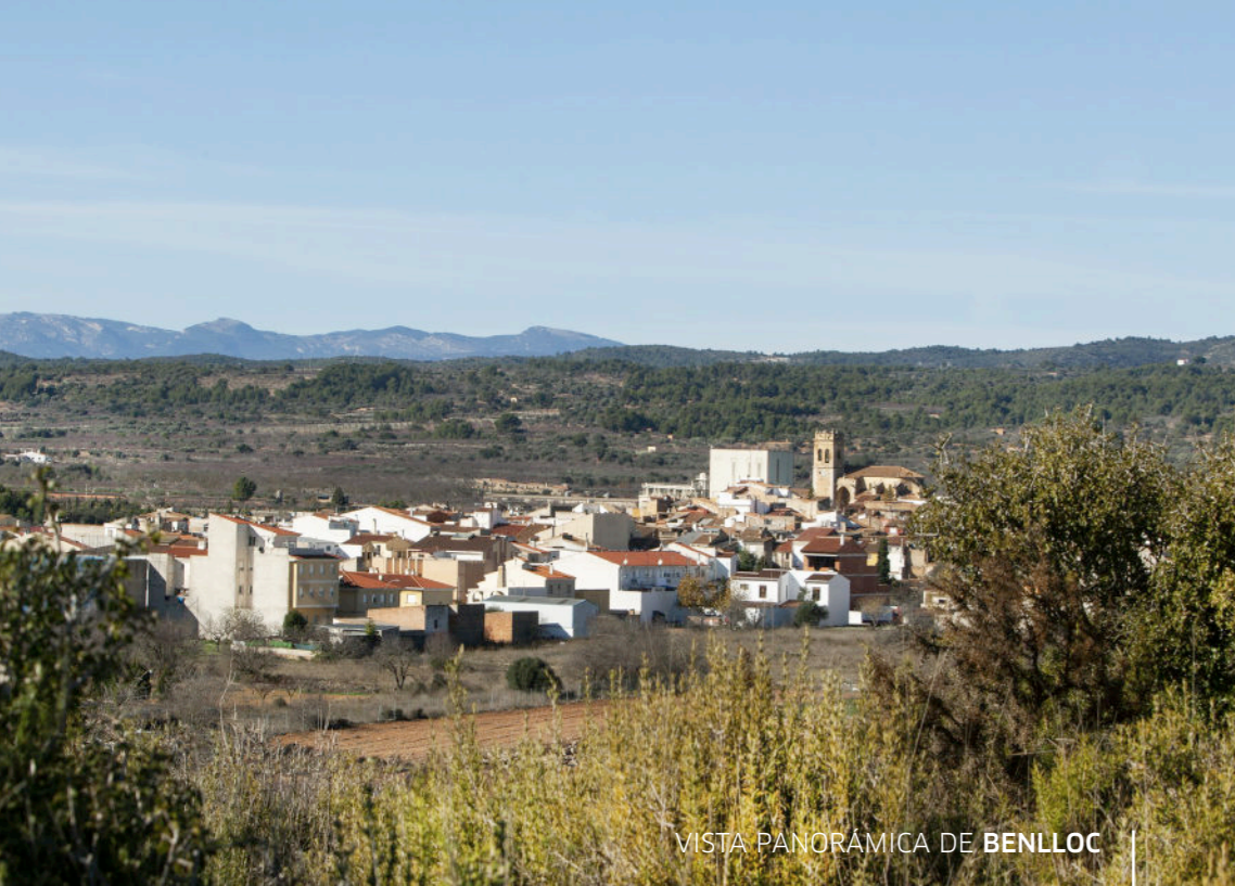
VISTA PANORÁMICA DE BENLLOC