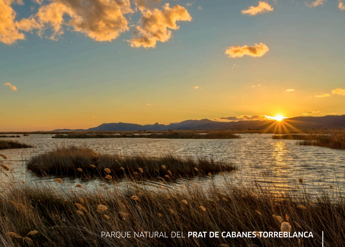
PARQUE NATURAL DEL PRAT DE CABANES-TORREBLANCA

TIERRA DE PAISAJES SALVAJEMENTE NATURALES, QUE FUERON TERRITORIO DE ÍBEROS, ROMANOS, MUSULMANES Y CRISTIANOS.