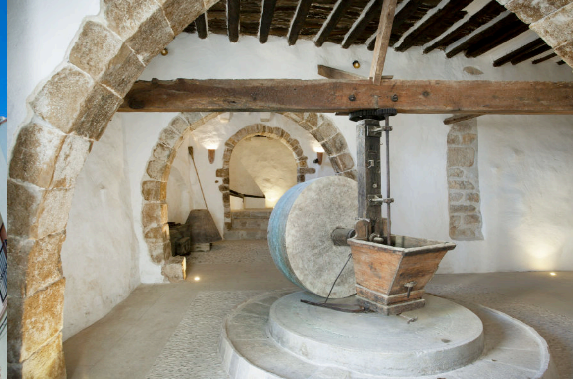
LA HISTÓRICA CASA SENYORIAL BOIX-MOLINER O CASA DE LES SENYORETES