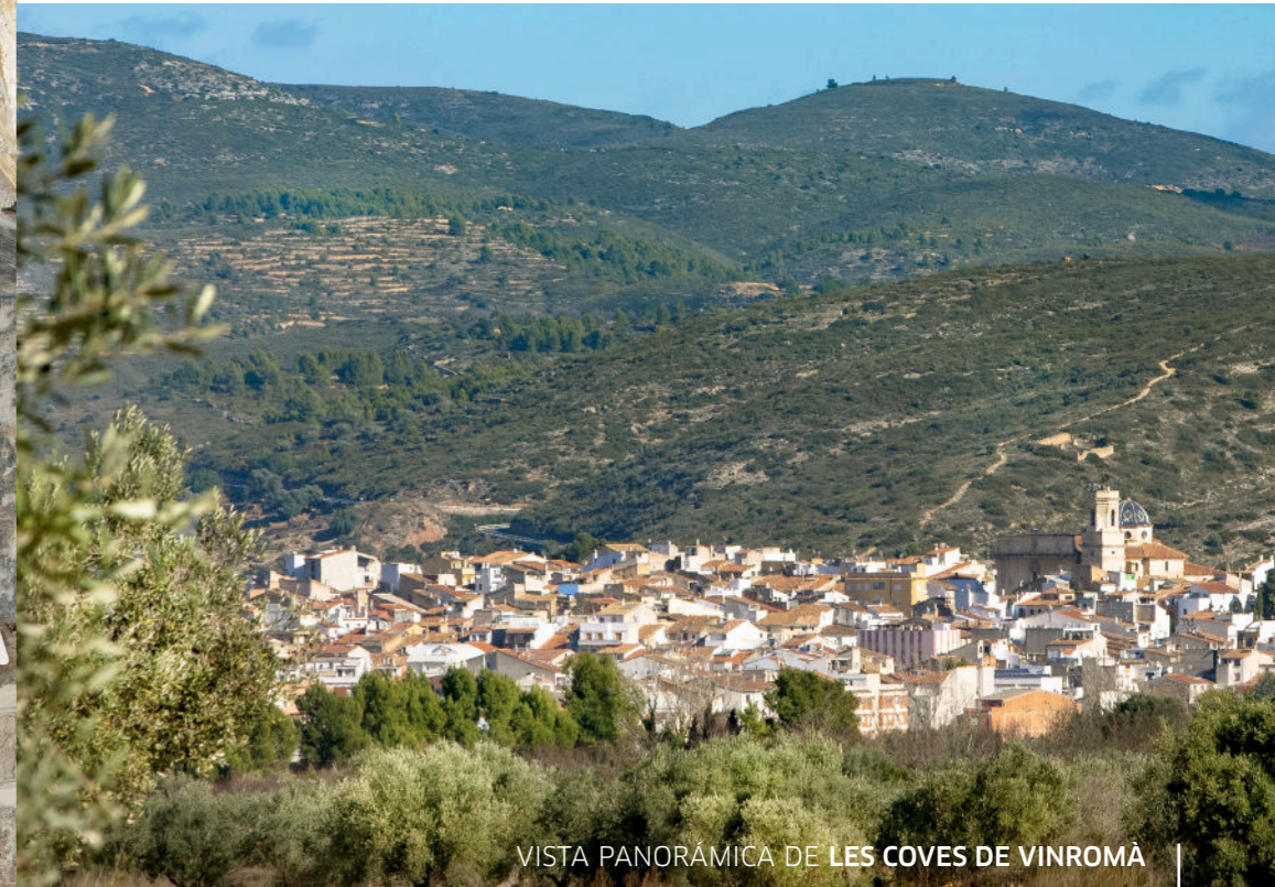
VISTA PANORÁMICA DE LES COVES DE VINROMÀ