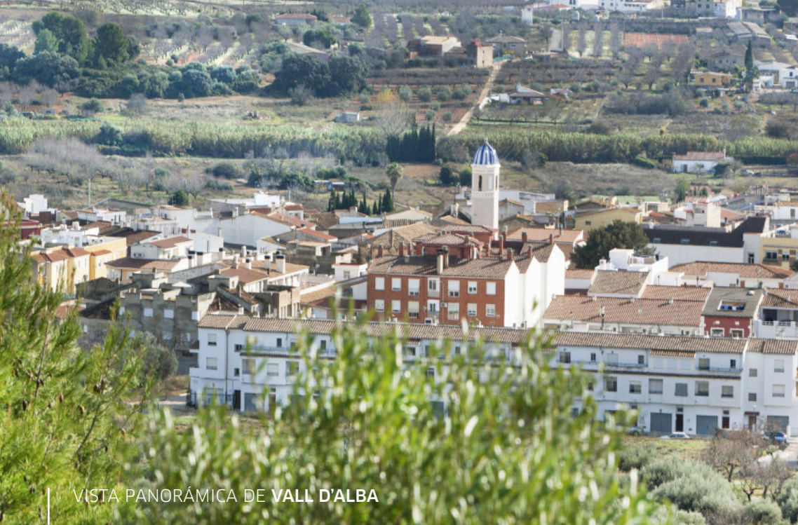
VISTA PANORÁMICA DE VALL D'ALBA