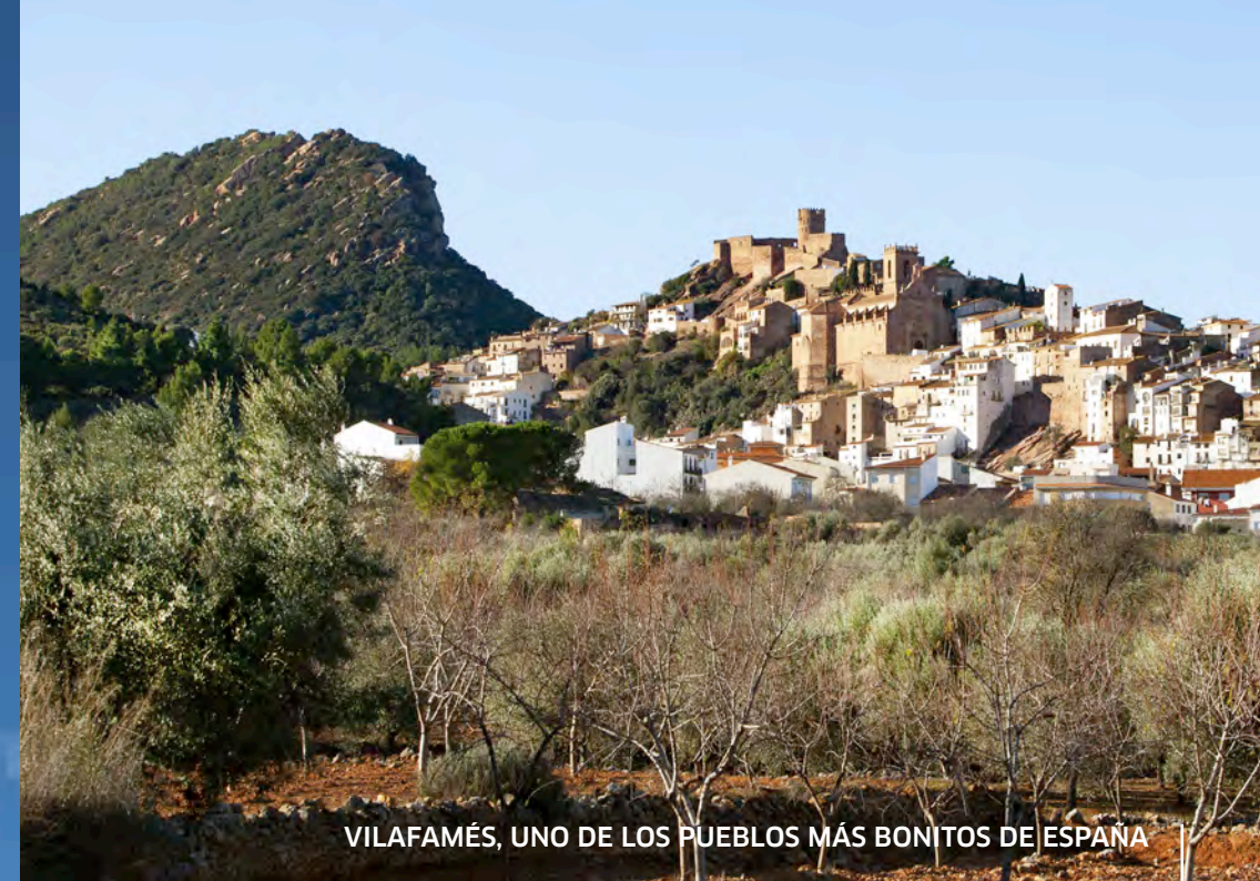
VILAFAMÉS, UNO DE LOS PUEBLOS MÁS BONITOS DE ESPAÑA

TIERRA DE CASTILLOS Y LEYENDAS ENAMÓRATE DE LA HISTORIA Y EL ARTE