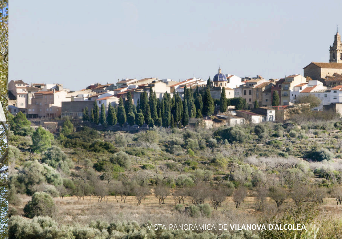
VISTA PANORÁMICA DE VILANOVA D'ALCOLEA

TIERRA DE CRUCE DE CULTURAS, UNA PARADA EN LA VÍA AUGUSTA, LA ESTACIÓN ROMANA DE ILDUM